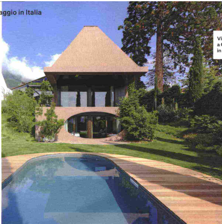
Villa Baronessa, a Caldaro, in Alto Adige.