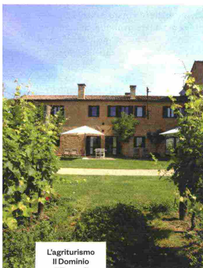
L'agriturismo Il Dominio di Bagnoli, vicino a Padova.