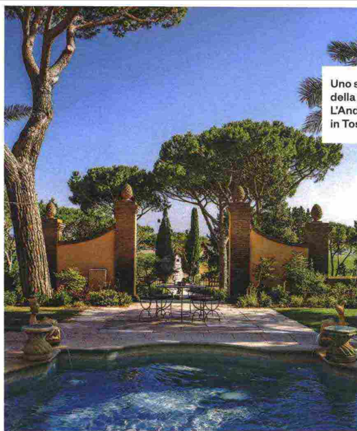
Uno scorcio della tenuta L'Andana, in Toscana.

In Puglia , Talea Collection offre una nuova selezione di ville, masserie e trulli di fascino. Con prima colazione, chef e massaggi in villa, escursioni in barca a vela e in bici, accesso alle spiagge private dello stesso Gruppo alberghiero. Il Limone, a Fasano , antica casa padronale, con volte a stella e due piscine, di cui una infinity con affaccio sull'agrumeto, è una delle più suggestive. Il resto è fatto di quiete,